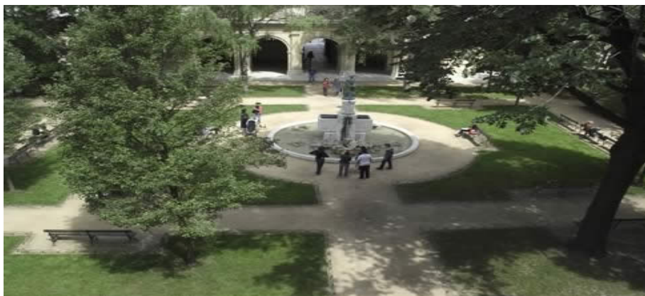
Jardin du musée des Beaux-arts de Lyon