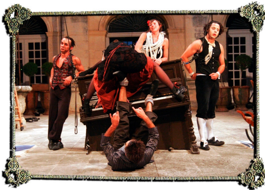
.. Troupe du . cirque « toccata »

comédien arrivait en se mettant dans un cercle en fer en le faisant tourner il se relevait et lorsqu'un des comédiens s'est mis à jouer de la musique avec une scie et un archer. J'ai aussi bien aimé l'aspect comique de cette pièce qui était très présent.