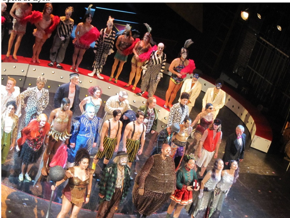
Troupe de comédiens « Les mamelles de Tirésias » et « Le bœuf sur le toit »