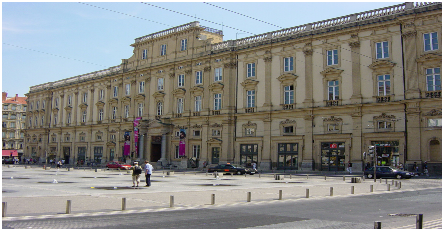
Musée des beaux-arts de Lyon

J'ai trouvé cette sortie au départ intéressante mais je me suis vite lassé car j'avais l'impression d'entendre souvent la même chose.