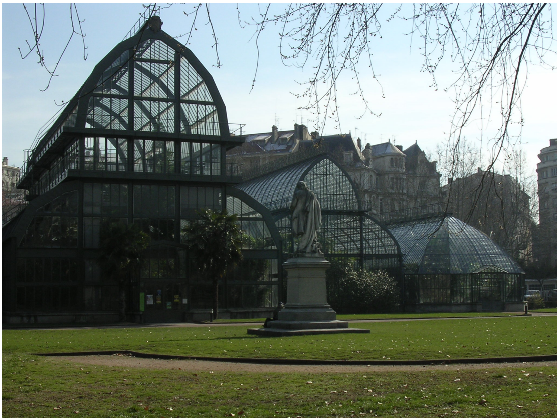
Les grandes serres du parc de la Tête d'Or