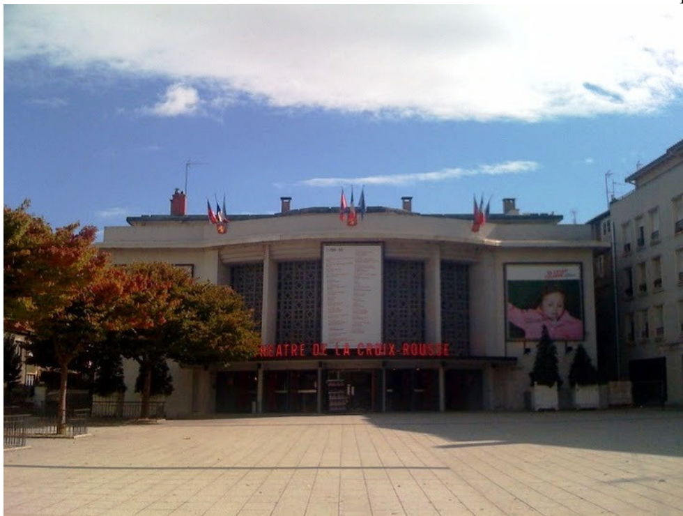
Théâtre de La Croix-Rousse