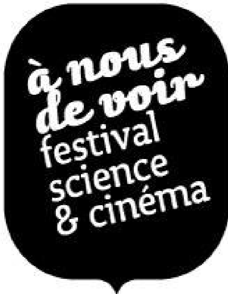
Affiche du festival « à nous de voir »

Je n'ai pas vraiment apprécié l'intervention car je trouve qu'elle n'a pas su capter réellement mon attention et cela ne m'a pas permis de voir différemment les images (alors que c'était le but). Alors que l'année passée j'ai eu une intervention du même genre et cela m'avait intéressé et captivé. Peut-être que je n'ai pas apprécié cette intervention justement parce que j'en ai déjà eu une sur le même sujet l'année dernière.