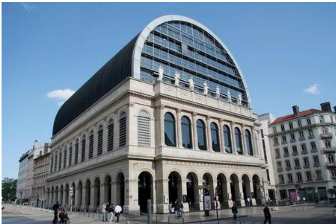
Opéra de Lyon