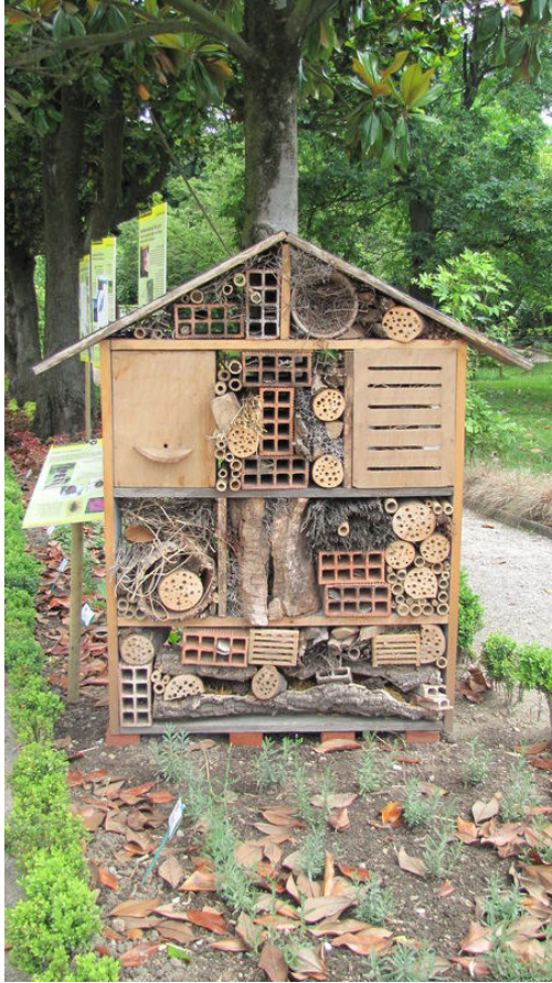
Hôtel à insecte