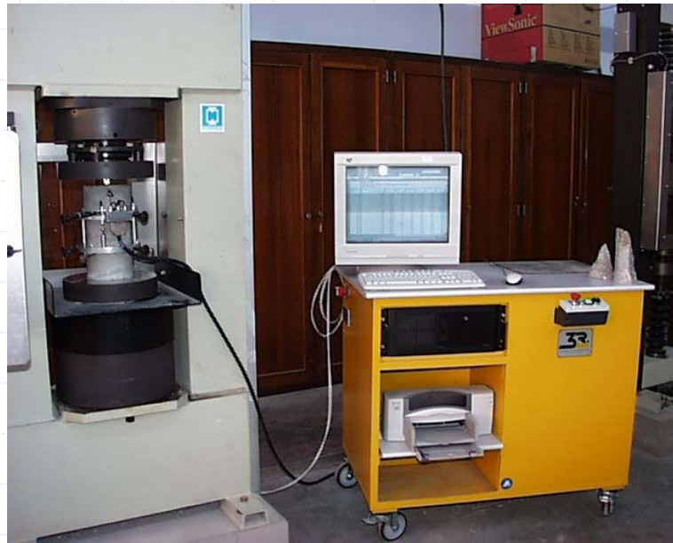
✓ Essai sur éprouvette cylindrique béton